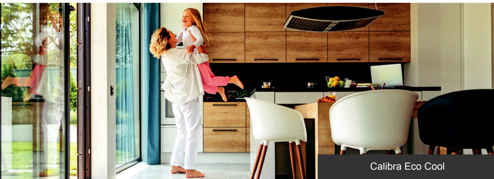
Calibra Eco Cool